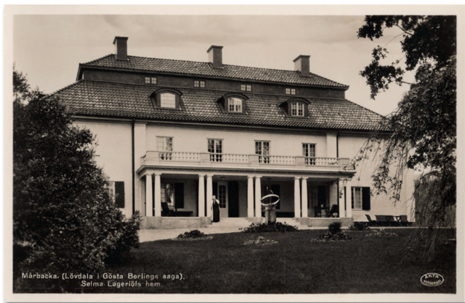
Mårbacka. (Lövdala i Gösta Berlings saga). Selma Lagerlöfs hem.

Efter den påtvingade försäljningen av Mårbacka flyttade Selma Lagerlöfs faster Lovisa till henne i Landskrona, och ett par år senare även mamman. Lagerlöf kom också på allvar igång med sitt författande. I ett brev strax efter debuten av Gösta Berlings saga skrev hon: ”Man säger ju, att det ofta behöfs en stor sorg eller en djup saknad för att lära en männi-ska att dikta och jag