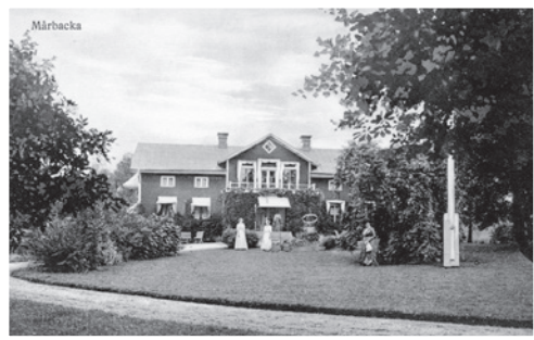
Mårbacka efter den första renoveringen 1908.