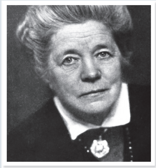
Selma Lagerlöf, 1916. Foto: Henry Goodwin. Utlånat av Mårbackastiftelsen.