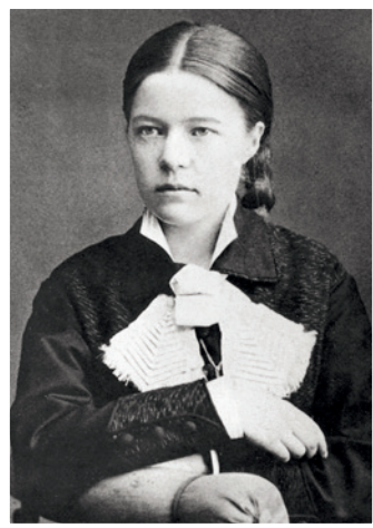
Selma Lagerlöf i 20-årsåldern.

Thackeray, Daudet, Flaubert, Ibsen, Bjørnson, Lie, Kielland, Turgenjev, Tolstoy, H. C. Andersen, J. P. Jacobsen, Shakespeare, Byron och Goethe.